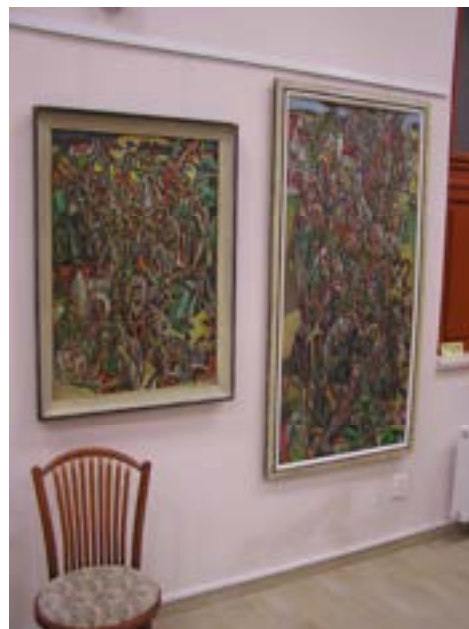
Obrazy J. Kodyma

Tradičně se ve výstavní síni muzea uskutečnila výstava žáků výtvarného oboru Základní umělecké školy v Náchodě. O oboustranně dobré spolupráci mezi organizacemi svědčí účinkování učitelů a žáků ZUŠ Náchod při slavnostních vernisážích výstav pořádaných naším muzeem.