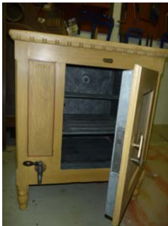
Výsledek konzervátorské práce