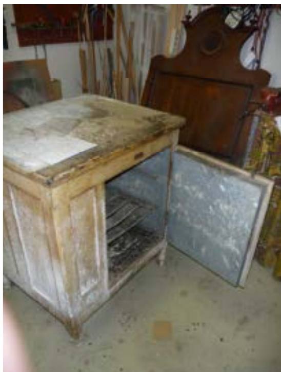
Lednička před zásahem konzervátora

Muzeum v průběhu roku vyřídilo 239 badatelských dotazů.