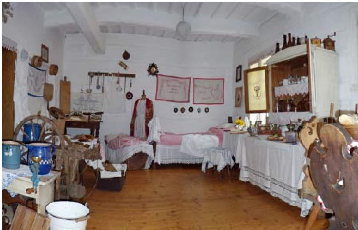
Fotografie z výstavy Krejčovská dílna a replika babičkovské kuchyně

Ve spolupráci s o.s. Cech panen rukodělných připravilo muzeum ve staré škole „Dřevěnce“ v Polici nad Metují výstavu Krejčovská dílna a replika babičkovské kuchyně.