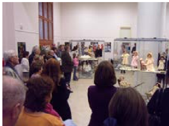
Z vernisáže výstavy historických panenek

Muzeum jako každoročně realizovalo vánoční výstavy jak v Náchodě, tak na pobočkách v Hronově a Polici nad Metují.