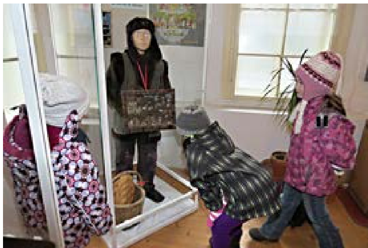
Z vernisáže vánoční výstavy v polické „Dřevěnce“