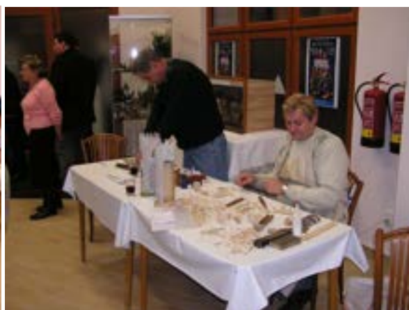
Výstavu Betlémy Náchodska, Hronovska a Policka navštívilo 727 platících návštěvníků (Náchod)