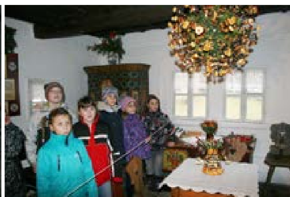
Staročeské Vánoce v Jiráskově rodném domku v Hronově