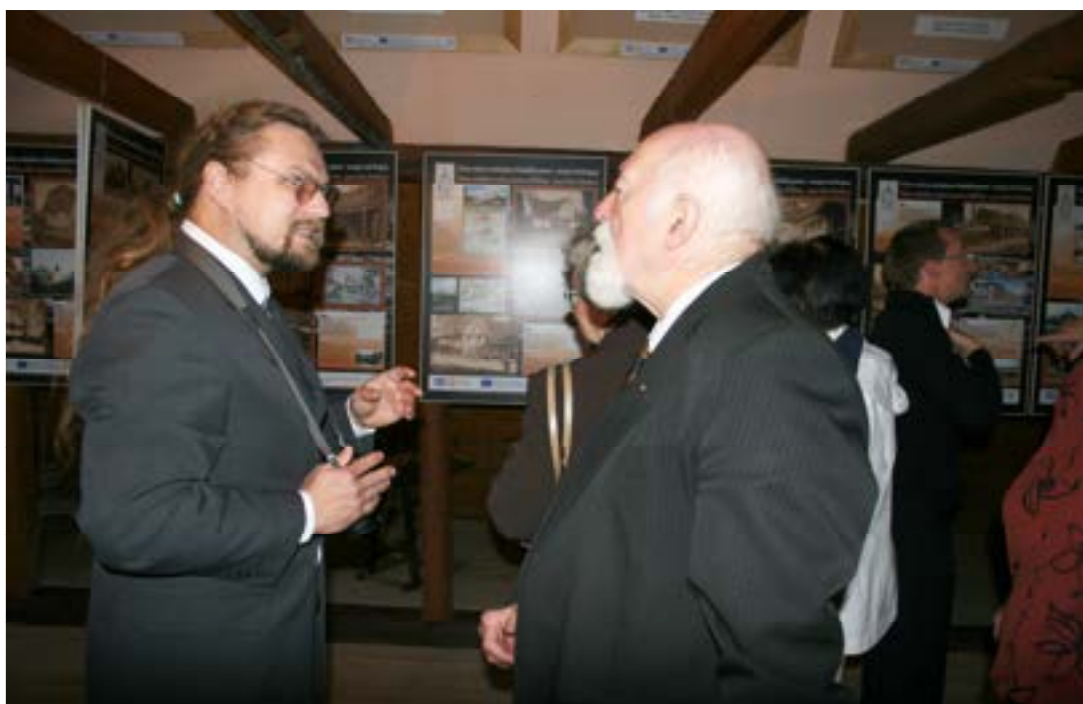
Vernisáž výstav ve skanzenu Muzea Kultury Ludowej Pogórza Sudeckiego w Kudowie Zdroju

Slibně se také rozvíjí i mezinárodní spolupráce. V rámci celé Evropy udržujeme kontakty s muzei majícími ve správě opevnění z 30. let 20. století. S polskými kolegy si vyměňujeme zkušenosti vždy v září na společném setkání českých a polských muzeí v rámci Dnů česko polské křesťanské kultury, které se v roce 2011 konalo v polské Kamienniej Góře. Vyvrcholením této spolupráce byl společný grant s Muzeem lidové kultury Stroužné Lidová roubená architektura na kladském pomezí –mizející tvář krajiny.