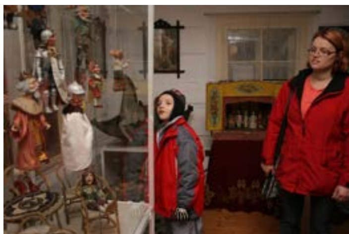
Kouzelný svět hraček v Dřevěnce v Polici nad Metují