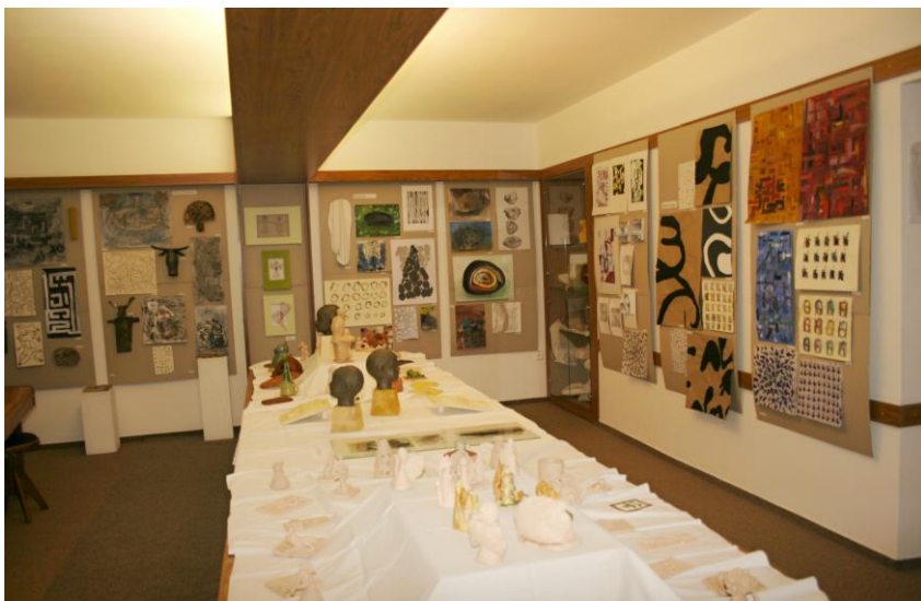
Výstava výtvarných prací žáků ZUŠ