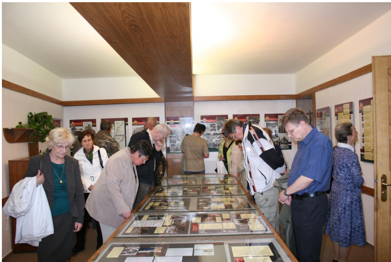
Vernisáž výstavy Běloveská tragédie

Byla snaha prezentovat takové výstavy, které by oslovily co nejširší veřejnost. Mezi ně patří např. výstavy Běloveská tragédie k 65. výročí konce druhé světové války či Jak mizel starý Náchod ve