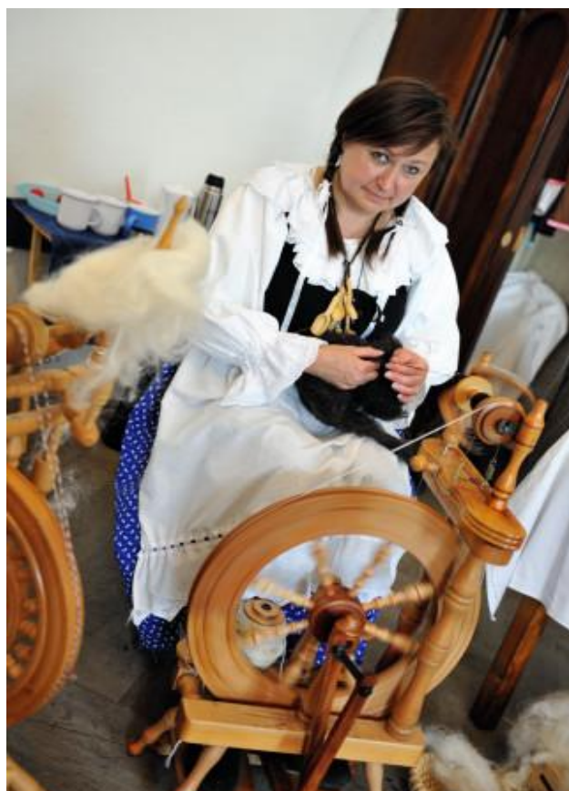
Den řemesel v Polici nad Metují

lednové výstavě se Základní uměleckou školou v Náchodě (výtvarné práce žáků).