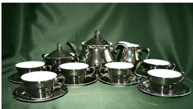
Z pozůstalosti Friedová

Počet zapsaných knižních jednotek činil 113.