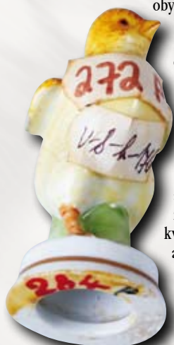
Drobná porcelánová figurka kuřátka pokrytá evidenčními čísly