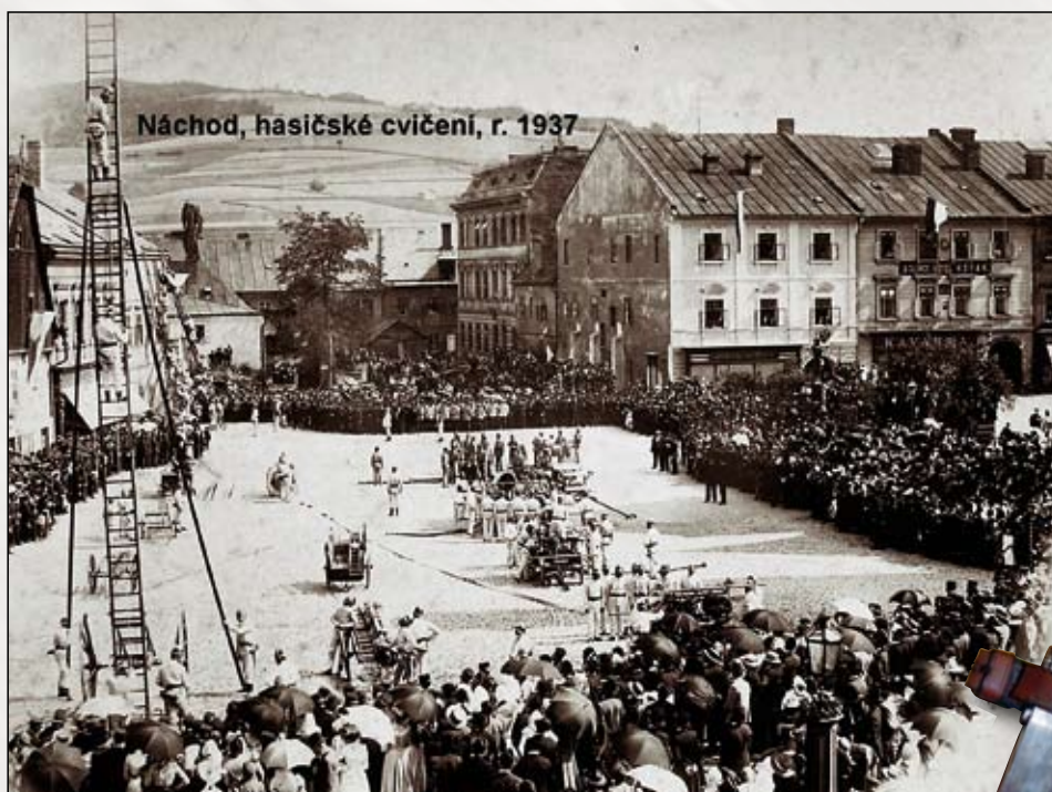
Hasičské cvičení r. 1937