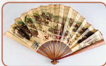
Papírový vějíř s upomínkou na Národopisnou výstavu československou v roce 1895 - přelom 19. a 20. století