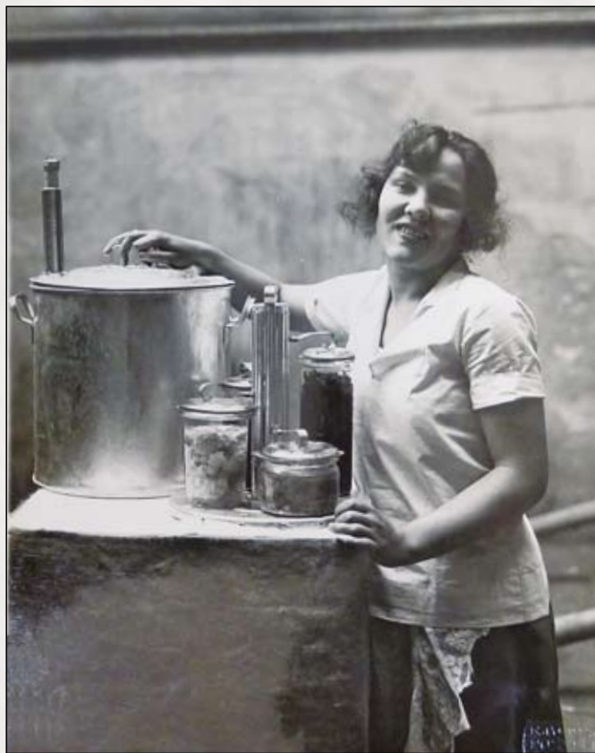
Dobová fotografie propagující weckování

...První pokus toho druhu bylo zavedení zavařování ovoce, zelenin a masa novou sterilizační metodou dle fy Weck v Badensku. Kdežto dřív mohla hospodyňka mající jen pergamen k dispozici, zavařovat jen ovoce (jež muselo být hodně oslazeno, aby se plíseň nechytala), tož při moderní sterilizaci dle Wecka nemusela ovoce vůbec sladit, a mohla zavařit kterákoli masa i hotové pokrmy, aniž vzniklo sebe menší nebezpečí plesnivění... Zavařování dle Wecka (čili „zaweckování“) rozšířilo se všeobecně tak, že za několik let zatlačilo zcela zavařování s pergamenem, a na konec (patenty později byly už prošlé) každá sklárna vyráběla zavařovačky více méně dokonalé, a sterilizace ovoce a pokrmů vnikla i do nejzapadlejšího venkova.“