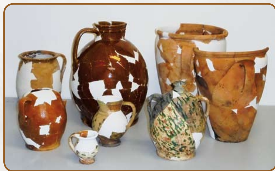
Vyhledané a zasádrované nádoby

Chybějící střepy, jež se nalézt nepodařilo a vytvářely prázdná místa v keramických nádobách, byly rekonstruovány. Vzhledem k zachování 2/3 nádoby a profilu bylo možné (s výjimkou hrdla čutory) doplnit nádoby celé. Důvodem pro doplnění chybějících částí byla jednak estetická stránka, avšak hlavně tímto krokem došlo ke stabilizaci a celkovému zpevnění předmětu, usnadňujícímu další manipulaci a použití pro výstavní účely. K doplnění byla použita bílá modelářská sádra,