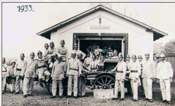
Běloveští hasiči v roce 1933

Mezi sbírkovými předměty našeho muzea se nacházejí i některé exponáty vztahující se k hasičské činnosti. Nejstarší pokusy o zakládání hasičských sborů, byť německých, spadají do let 1854-1861 a v březnu 1864 dochází k založení prvního ryze českého hasičského sboru ve Velvarech. Postupně jsou zakládány další hasičské sbory, a tak i v Náchodě vznikl při zdejší sokolské jednotě hasičský odbor, který existoval v letech 1869-1870. Teprve v roce 1885 však byl z podnětu purkmistra Jana Tichého založen samostatný hasičský měšťanský sbor, do kterého se přihlásilo 65 občanů města. O dva roky dříve se datuje také vznik sboru dobrovolných hasičů v Bělovsi.