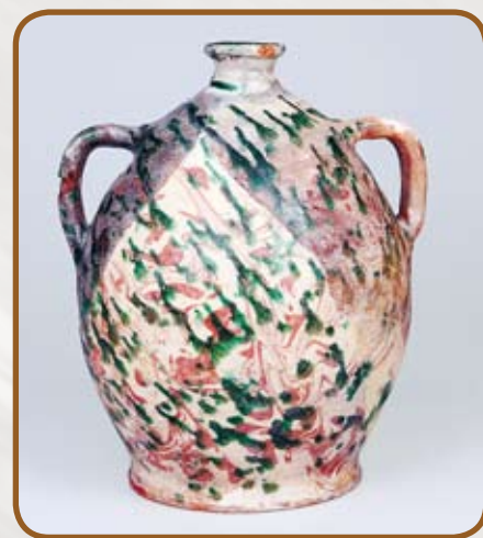
Čtura po dobarvení doplněných ztrát

kteřá byla nanášena na vytvarované podložky kopírující tvar nádoby. Po vytvrdnutí se upravovala různými hoblíky, očky, špachtlemi a následně byla vyhlazena jemným smirkovým papírem. Přebytečný sádrový prach byl odstraněn omytím ve vodní lázni. Na závěr je možné bílé sádrové doplňky dobarvit, k čemuž se nejčastěji přistupuje z důvodu prezentace na výstavách. Zvolená barva by měla ladit s barevností nádoby. Vybraný odstín by měl být o tón světlejší nebo tmavší než originál, aby barevnost nerušila vizuální vjem, avšak aby zároveň při pohledu z blízka bylo možné rozlišit původní střepy od sádrových doplňků. Zpracované keramické nálezy byly na závěr fotograficky zdokumentovány, vytříděny na části těl, spočítány, zabaleny a zjištěné údaje zaznamenány do evidenční tabulky.