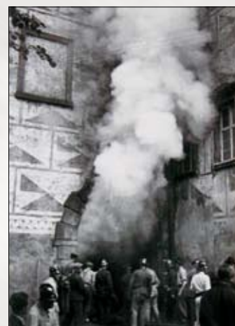
Požár na zámku v roce 1934