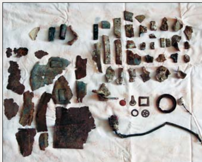
Nálezy z místa dopadu