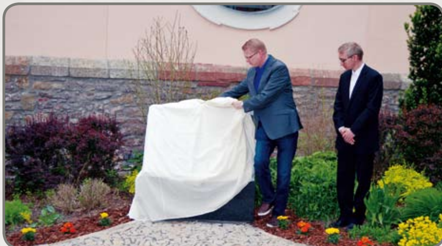
Odhalení pomníku ministerským předsedou vlády Pavlem Bělobrádkem