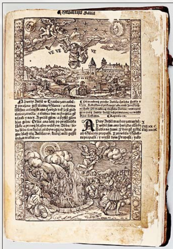
Ukázka dřevorytových ilustrací z Melantrichovy bible

V kolo fonu se nachází tiskařské signety obou tiskařů. V případě Bartoloměje Netolického se jedná o jeho erb umístěný v renesančním portálu, s mořskou pannou se dvěma ocasy přepásanou šerpou, umístěnou na štítě a také nad ním. Signet Jiřího Melantricha je obdobou signetu jeho učitele, basilejského tiskaře Johanna Frobenia. Jedná se o prostý obdélník, zúžený po stranách dvěma renesančními sloupy. Z levého vystupuje ruka, držící meč s holubicí na hrotu. Meč je obtočen dvěma hady s hlavami proti sobě. Na bílém pozadí jsou dvě šesticípé hvězdy a při horním okraji rámu na bílé pásce GMR (Melantrichův monogram).