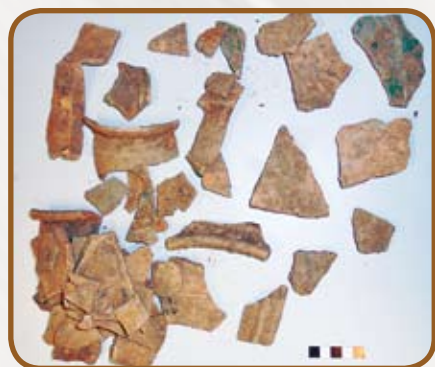
Keramické střepy před omytím

Nálezy z parku byly umístěny celkem do sto jedenácti sáčků v sedmi bednách. Převážnou část z nich tvoří keramické střepy. Menší podíl představují skleněné střepy, železo, zvířecí kosti, mazanice a stavební keramika. Prvním krokem laboratorního zpracování je omytí nálezů. Pomocí vody a kartáček byla z povrchu a především z hran střepů odstraněna zemina. Při mytí je pečlivě sledován stav předmětu, aby nedošlo k poškození jeho povrchové vrstvy nebo destrukci. Omyté nálezy jsou poté ponechány k volnému usušení. Tímto způsobem se omývá stabilní keramika, stavební keramika a kosti. Naproti tomu není možné takto ošetřit sklo a železo, jež vyžaduje jinou formu zásahu, proto bylo svěřeno do odborné péče restaurátorů.