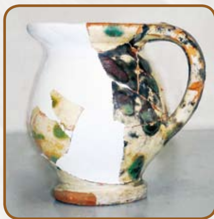
Nádoba po doplnění ztrát

nění vyhledávání byly vytříděny podle barevnosti a typu nádob. Střepy pasující k sobě byly navzájem lepeny, a to ode dna nádoby, aby se nevytvořily uzavřené prostory, kde by bylo zapotřebí přilepit další střepy. Obvykle není možné nádobu vyhledat celou. Náchodský výzkum nepředstavuje v tomto ohledu výjimku, ale i tak se podařilo z velké části zkompletovat osm novověkých keramických nádob, což je nesporně úspěch. Jednalo se o velký džbán glazovaný z obou stran, dva malé trasakované a glazované džbánky, dvě čutory, z nichž jedna je trasakovaná a druhá glazovaná z obou stran (bez dochovaného hrdla), dva velké neglazované hrnce a jeden vně glazovaný hrncem na boční ohřev.