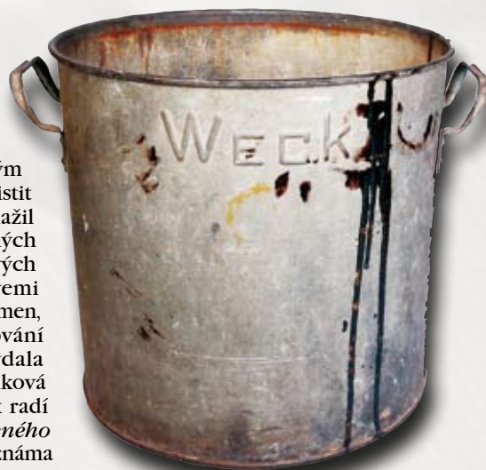
Zavařovací hrnec firmy WECK

Snaha dlouhodobě uchovat potraviny a zabránit přirozeným rozkladným procesům provází člověka od počátku dějin, a to z pochopitelné potřeby zajistit si potraviny na dobu, kdy nebude možné obstarat si čerstvé. Člověk se snažil potraviny sušit, udit, mrazit, vařit, nakládat do nejrůznějších roztoků i suchých směsí a v poslední době i uchovávat v ochranných atmosférách, či vakuových baleních apod. Od 18. století se setkáváme s rozměrnými válcovitými láhvemi a sklenicemi s vně přehnutými okraji, přes něž bylo možné uvázat mokřý pergamen, který po vyschnutí neprodyšně uzavíral obsah. Není divu, že o konzervování píše i Magdalena Dobromila Rettigová, která svou Domáci kuchařku vydala v roce 1826 a mimo jiné zde doporučuje, aby například vychladlá meruňková zavařenina byla dána do „skleněných, neb porculánových nádobek“ a pak radí „nech ouplně vystydnout, pak papírem dobře obvaž a do suchého studeného místa k rozličné potřebě schovej“. V době vydání této kuchařky již však byla známa tepelná sterilizace potravin, jejíž objev souvisel s císařem Napoleonem Bonapartem. Ten v r. 1795 ještě jako generál dělostřelectva vypsál značnou odměnu 12 000 franků