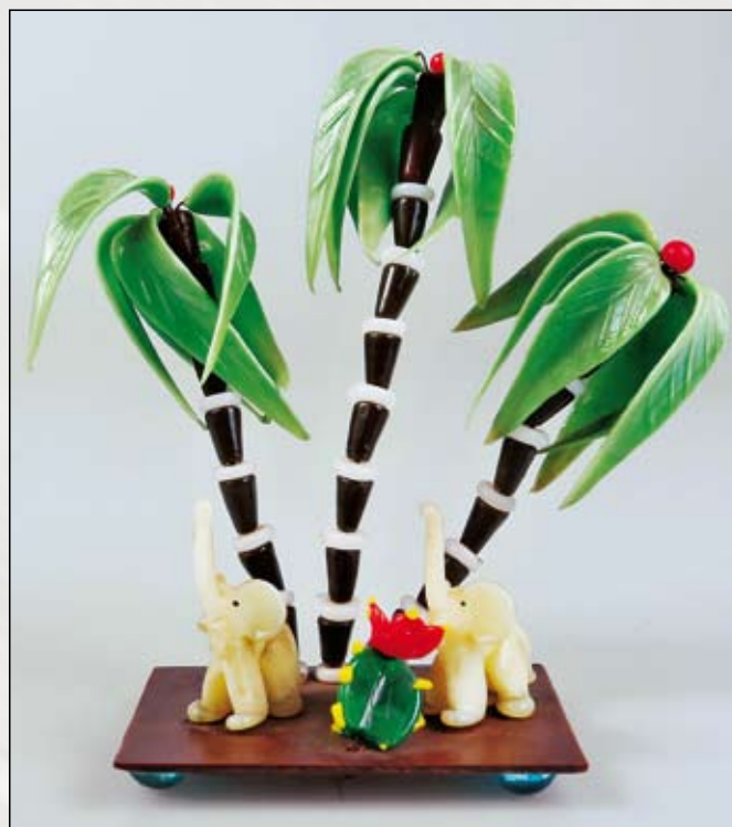
Drátkované a modelované figurky