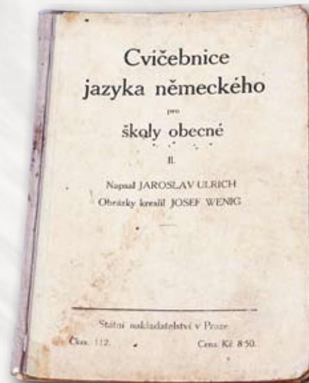
Cvičebnice jazyka německého