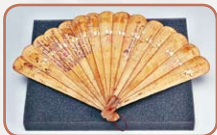
Dřevěný vějíř s tanečním pořádkem z konce 19. století