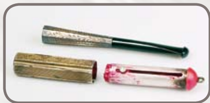
Stříbrná cigaretová špička a pouzdro na rtěnku

stát, jemuž přísluší hospodaření s movitým a nemovitým majetkem dle ustanovení zákona č. 219/2000 Sb. Vykonavatelem pozůstalosti se stává Úřad pro zastupování státu ve věcech majetkových (ÚZSVM), jenž nejprve přezkoumá, zda majetek může sloužit potřebám státu. Souhlas s převzetím předmětů sbírkové povahy do muzea uděluje Ministerstvo kultury ČR. V těchto případech navštívujeme domácnosti, kde nacházíme „poklady všedních dní“. Věci, které z dnešního hlediska nemají vysokou finanční hodnotu, neboť jsou zastaralé, nemoderní či poškozené. Pro nás však mají nedozírný kulturně historický význam, protože jsou cennou výpovědí o době minulé či o životě obyčejného člověka. Ročně je v muzeu zpracována jedna až dvě pozůstalosti.