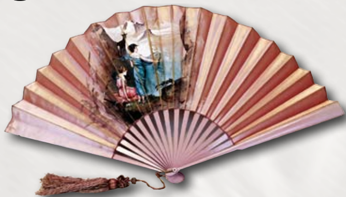
Hedvábný vějíř z konce 19. století

Samostatný zajímavý fenomén představuje rovněž „řeč vějířů“, která se vyvinula v 17. století na území Španělska. Stala se tak oblíbenou, že se rázem rozšířila po celé Evropě. Jemné třepotání, nenápadné skládání či letmé pohyby, to vše mělo vnímavému pozorovateli sdělit mnohé, a jelikož se setkávání pánů