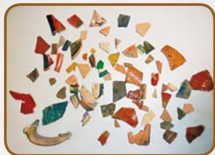
Rozložené keramické střepy

Poté následoval další krok – keramické střepy byly rozloženy na podložku dle nálezové situace (sond) a začalo shledávání jednotlivých dílků. Z některých sond se podařilo vyhledat pouze několik k sobě patřících střepů, avšak např. v sondě 4 se nacházelo velké množství střepů podobného vzhledu, u nichž bylo možné předpokládat torza nádob. Pro usnad-