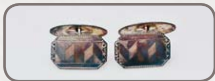
Stříbrné manžetové knoflíčky

vyryt nový monogram, a pravděpodobně i náramek. Pán možná na oplátku od manželky obdržel manžetové knoflíčky ze stejného materiálu s podobným zdo-