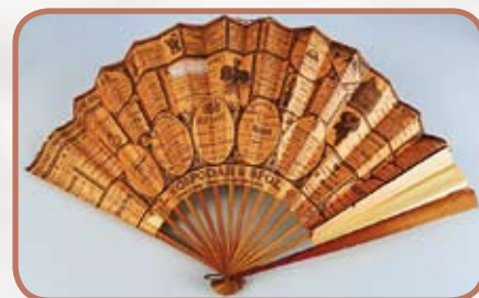
Rub papírového vějíře s dobovými reklamními tisky