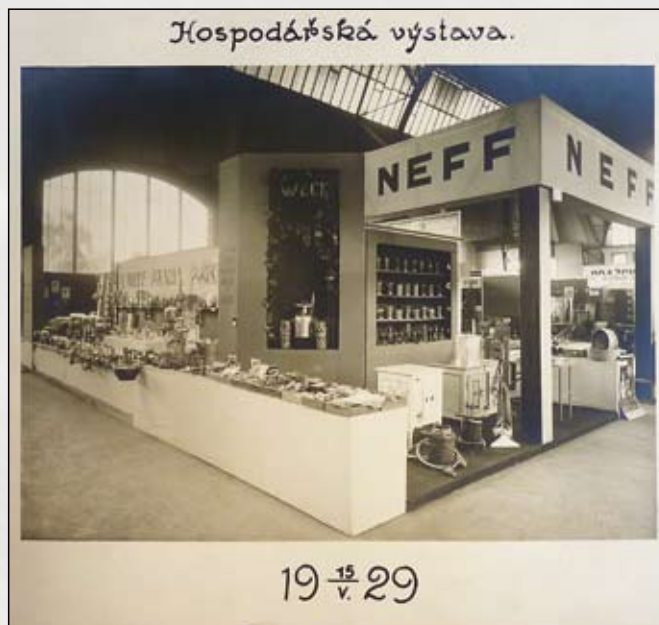
Výstavní stánek firmy Neff

V katalogu firmy Neff z roku 1911 je popsán celý přístroj a jeho fungování následovně: „Weckův přístroj se skládá ze skleněných lahví různých tvarů i velikostí a hrnce k vaření s teploměrem, na němž teplota při sterilizaci se kontroluje. V hrnci stojí stojan sterilizační s pružnými péry, jež při vaření přidržují víčka na lahvích. Všechny lahve mají stejný způsob uzavření; totiž hlazený rovný okraj, na který klade se gumový kroužek a na něm pak spočívá víčko s rovněž hlazeným okrajem. Hermetické uzavření zakládá se tu na využitkování tlaku vzduchu. Láhve zahřívají se v hrnci vodou naplněném takřka až do varu, při čemž víčko, aby se nesesmeklo, je shora zpruhou přidržováno. Teplem vypudí pára uvnitř sklenice se nalézající vzduch, a když při skončení zahřívání sklenice opět vychladnou a pára zas srazí se na vodu, nemůže již vzduch dovnitř zpět, a nastane uvnitř lahve pod víkem vzduchoprázdnota – vakuum.“