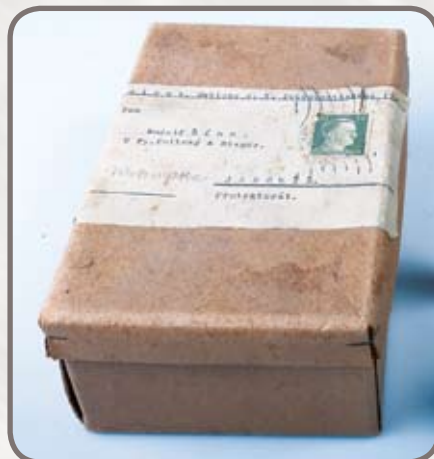
Kartonová krabička s bižuterií

Rovněž do života této domácnosti zasáhla válka. Svědčí o tom kartonová krabička s bižuterií z Jablonce nad Nisou, zabalená ještě v původním obalu s razítkem a poštovní známkou s vyobrazením Adolfa Hitlera. Jiným takovým