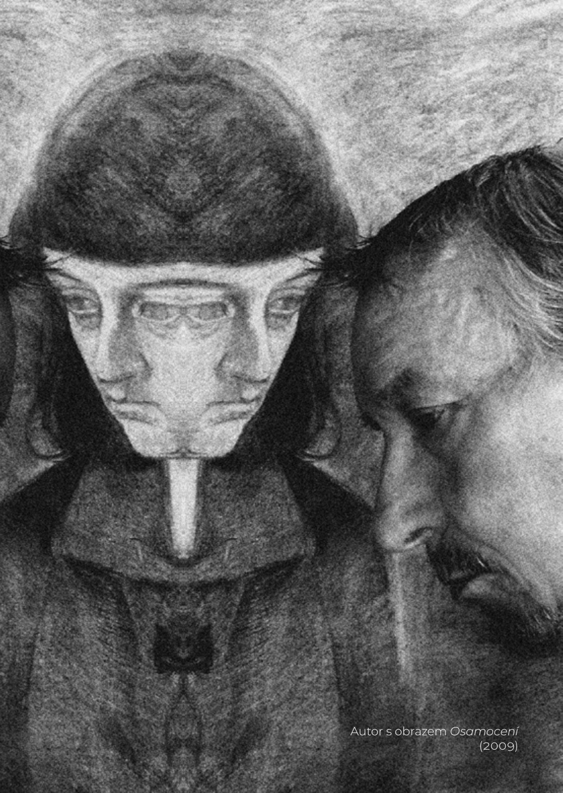
Autor s obrazem Osamocení (2009)